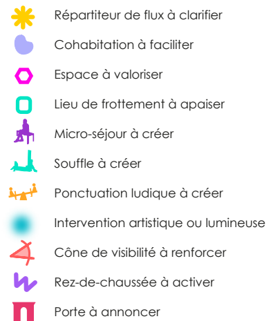
Schéma programmatique Noeud d'acupuncture: Pont Boieldieu