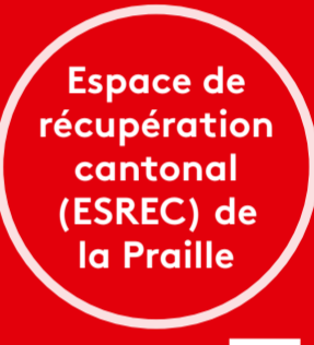
Espace de récupération cantonal (ESREC) de la Praille