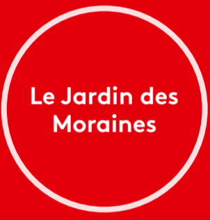
Le Jardin des Moraines