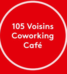
105 Voisins Coworking Café