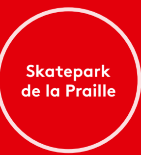
Skatepark de la Praille